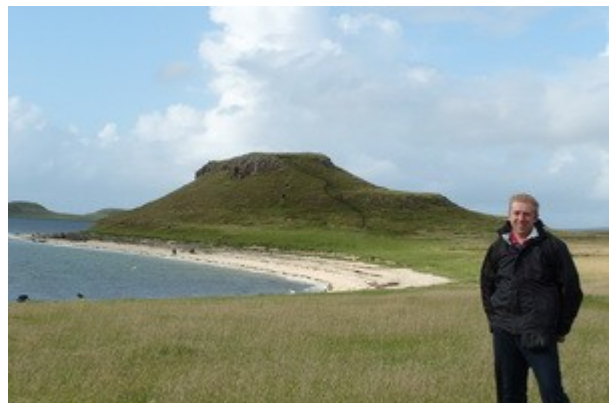
La bellissima Coral Beach, nell'est dell'isola di Skye.

Giusto il tempo di fare due foto alla prima spiaggia che dobbiamo gia' scappare per tornare a Portree. Non abbiamo con noi ne' ombrello ne' impermeabile (eravamo convinti che la spiaggia fosse vicino al parcheggio, non a quasi 4 km!) e ci aspettano altre 2 miglia a piedi controvento, in salita, con nubi minacciose e non vogliamo/possiamo arrivare tardi a Portree o rischiamo di trovare pub e ristoranti chiusi o pieni.