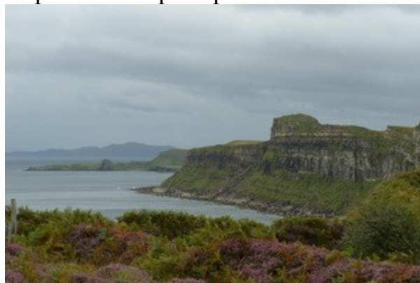
Un altro paesaggio di questa bellissima isola.

Il giro dell'isola e' comunque semplicemente stupendo. Forse poteva essere fatto anche in auto, ma sicuramente, conoscendoci, ci saremmo fermati ad ogni punto panoramico possibile. L'autista invece, esperto della zona, conosce gia' i punti migliori e ci permette di fare un "best of" che in 3 ore ci guida alla scoperta della zona nord-ovest. Le parole (almeno le mie) non potrebbero descrivere