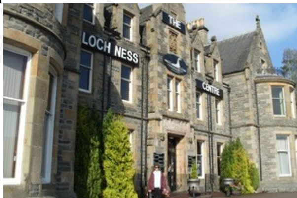
Il Visitor Center ufficiale di Lochness

Chi pensa quindi al Lochness come ad uno specchietto per le allodole con migliaia di persone che campano su una leggenda dovra' ricredersi. E' solo un bellissimo, stupendo, lago dove c'e' una famosissima leggenda, ma nulla di piu', nessuna