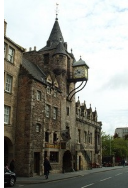
Un edificio caratteristico sul Royal Mile

I biglietti di questa settimana infatti sono stati tutti venduti a Dicembre dello scorso anno ! E fa sicuramente impressione se pensiamo che questo vuol dire decine di migliaia di biglietti venduti dai 70 ai 200 euro a testa a seconda della posizione.