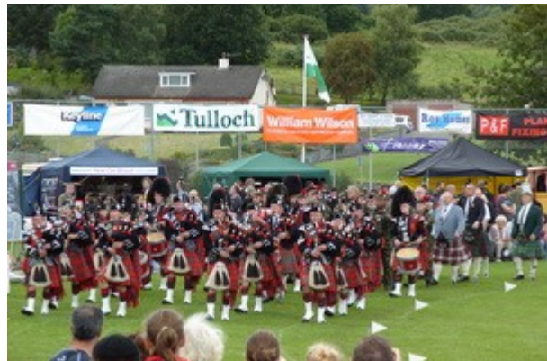
Esibizione di una Pipe Band Scozzese per l'apertura degli Highland Games.

I giochi sono abbastanza strani, si va dal lancio del tronco, al lancio in alto e in lungo del peso (due discipline ben distinte) al tiro alla fune. Passiamo una giornata molto tranquilla, ogni tanto scende qualche goccia ma noi siamo ben riparati al coperto; ci dicono che i giochi grandi, con piu' discipline e piu' atleti, sono quelli fatti a Edimburgo e Inverness e che questi servono come qualificazione regionale.