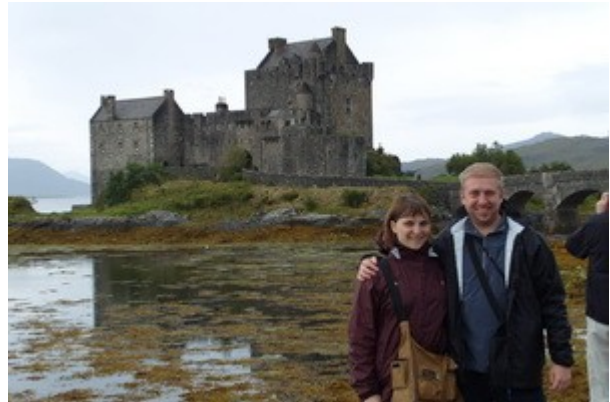
Il 'castello di Highlander', Eilean Donan.

La ricostruzione comunque è avvenuta scrupolosamente secondo le vecchie mappe e i vecchi dipinti e utilizzando, nei limiti del possibile, le pietre originarie, quindi lo possiamo visitare praticamente come è stato al massimo del suo splendore. Facciamo due foto, due acquisti al Visitor Center e ci dirigiamo verso Portree, capoluogo dell'isola di Skye, che dista circa 1 ora e dove abbiamo già