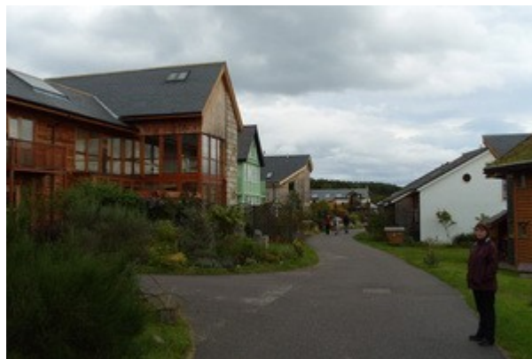
Il villaggio-comunità di Findhorn.

Ci fermiamo una mezz'ora tranquilli in riva al mare dopodiché decidiamo di dirigerci verso la vicina Findhorn. Questo paese è estremamente caratteristico, bello, ed unico nel suo genere. A farla breve, negli anni '60, in pieno movimento hippy, un gruppo di persone ha fondato questa "Comunità spirituale", come la definiscono loro, basata sull'eco-compatibilità, il ricorso alle energie