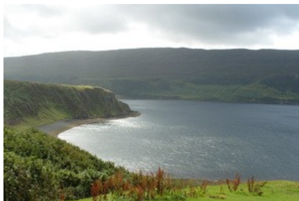
Il paesaggio della baia vicino a Stein.

tutti i turisti che non avevamo trovato nel resto della Scozia, il prezzo non e' proprio economico, castello + giardini a 7,50 euro ma decidiamo comunque di entrare, non