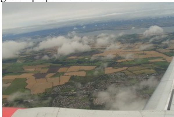
Ultimo scorcio di Scozia sull'aereo del ritorno.

ovviamente, il bello di un Fly and Drive cosi' e' proprio quello di potersi muovere liberamente come, dove e quando si vuole. Se si vuole fare un viaggio perfetto, vedendo tutte le cose piu' belle, gia' prenotate da casa e senza saltarne nessuna, bisogna essere estremamente organizzati e viaggiare seguendo precise tabelle di marcia, cosa che, per come concepisco io una vacanza, e' l'esatto opposto di quello che voglio. Gia' tutto l'anno siamo "stretti" da orari e cose da fare, in vacanza voglio buttare l'orologio in fondo alla valigia e godermi giorno per giorno la liberta' e la bellezza dei luoghi dove sono, andando a dormire ogni sera senza sapere con precisione cosa faremo e dove saremo il giorno dopo.