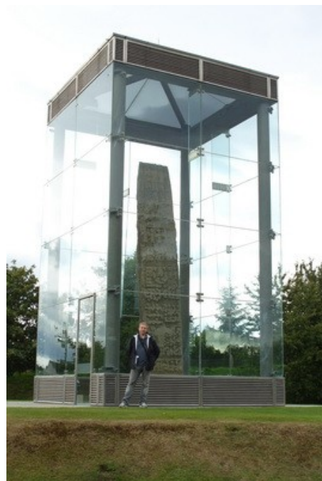
Il piu' alto menhir delle isole britanniche.

Le vetrine, che ad esempio in Italia sono tanto belle da vedere (almeno per il gentil sesso), qui non esistono fuori dall'orario di apertura. La maggior parte dei locali infatti dopo l'ora di chiusura (tra le 17 e le 18) chiude letteralmente anche le serrande fino al