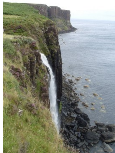
Una bellissima veduta delle scogliere dell'isola.

Nel mezzo circa 8 ore di pullman, 2 ore di traghetto e quel che rimane per il giro sull'isola. Il tutto al "modico" prezzo di 55 sterline a testa. Sicuramente troppo, tutte e due le cose, ma ci piace l'idea di saltare le Orcadi, non veniamo in Scozia tutti gli anni e probabilmente ne passeranno un po' prima di tornarci di nuovo. Per ora lasciamo l'idea in sospenso e torniamo in camera dove ne approfittiamo per studiare un po' le tappe dei prossimi giorni e scrivere le cartoline.