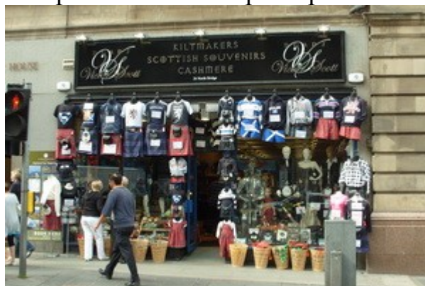
“Il paradiso del Cashmere”, dal maglione al kilt a prezzi di fabbrica :)

La visita finisce poco dopo, alle 10 circa, e abbiamo la giornata libera. Purtroppo però quando usciamo scopriamo che piove e questo limita un po' gli spostamenti a piedi. Decidiamo comunque di vedere tutto il Royal Mile. Questa è la strada (lunga appunto un miglio) che collega il castello (in cima alla strada) a quella che all'epoca era la residenza locale del re e della regina (in fondo).