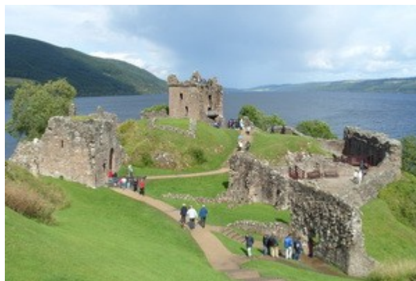
Il castello di Urquhart sul lago di Lochness.

Prima tappa pomeridiana e' il vicino castello di Urquhart, veramente bello e meritevole di una visita e anche qui, nuovamente, abbiamo prova della gentilezza degli scozzesi. Alla cassa ci propongono un biglietto cumulativo per piu' castelli e siti storici scozzesi, noi decliniamo e acquistiamo solo l'ingresso a questo castello; dopo pochi minuti vedendo una locandina e fatti due conti