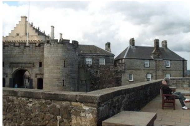
La baia di Inverness, ideale per l'avvistamento dei delfini.

La torre dista pochi chilometri ma ce li preferiamo evitare anche perche' ormai e' quasi ora di cena e preferiamo concludere la giornata con una veloce cena e un bel riposo.