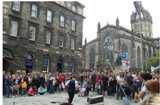
Uno dei tanti spettacoli all'aperto del Fringe Festival, a Edimburgo.

Lasciamo il posto alle 12 circa e dopo un buon pranzo per strada arriviamo in uno dei parcheggi "satellite" fuori città, collegati con delle navette con il centro; oramai infatti i parcheggi più vicini sono tutti pieni e sicuramente così risparmiamo tempo e traffico. Da subito l'impatto con la città è impressionante per noi che veniamo da 12 giorni dove la città media ha 4-5.000 abitanti.