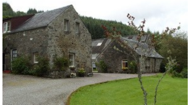
Il nostro b&b a Inveraray.

La sera qui e' tutto tranquillo e dopo cena ce ne torniamo dritti al b&b. Il programma "base" del dopo cena e' una doccia sempre calda (tutti i b&b li cerchiamo con il bagno in camera, visto che la differenza di prezzo e' veramente minima, di solito 8-10 sterline), un'occhiata alle foto, eventualmente si guarda un film o si legge un libro e poi ci si addormenta.