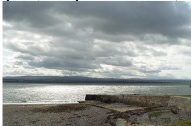
La baia di Inverness, ideale per l'avvistamento dei delfini.

La mattina rimaniamo ancora in Inverness perché siamo interessati all'avvistamento dei delfini. Poco a nord infatti c'è una grossa baia dove diverse colonie di delfini ogni estate vengono a ripararsi per far nascere e crescere i propri cuccioli. Ci affidiamo ai consigli della Lonely Planet e del Visitor Center sui delfini che, oltretutto, ci consigliano lo stesso posto, ovvero lo stretto di terra che separa la baia dall'oceano e dove, quasi ogni giorno, si avvistano i delfini che arrivano, o partono, per la pesca in mare aperto.