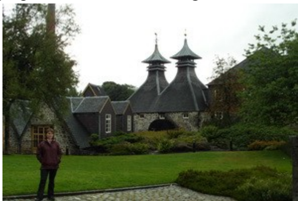
Lo Strathisla, una delle più antiche e belle distillerie di Whisky nello Speyside.

Scegliamo perciò l'unica che è aperta la domenica mattina e, per fortuna, scopriamo anche che è una delle più belle e antiche di Scozia. La distilleria è quella della Strathisla, famosa per l'omonimo Whisky ma anche per essere produttrice e proprietaria del Chivas Regal.