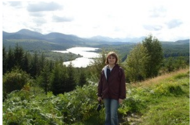
Uno dei tanti punti panoramici oggi per strada.

Lungo la strada però facciamo fatica a non fermarci ogni 5 minuti. Troviamo ovunque infatti paesaggi da sogno, che in fotografia non riescono purtroppo nemmeno lontanamente a riproporre le emozioni e le sensazioni provate dal vivo, curva dopo curva. Nel giro di pochi minuti passiamo dal fondo di vallate alla cima di colline dove il panorama continua a lasciarci a bocca spalancata.