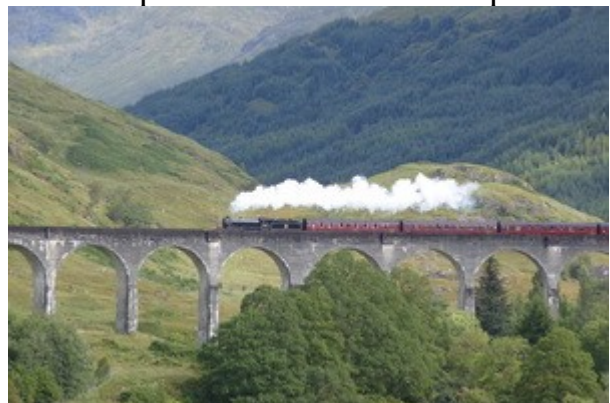
Il Jacobite (o 'Hogwarth') Express a Glenfinnan

Quasi alle 11 infatti sentiamo fischiare, vediamo un po' di fumo ed ecco quindi il Jacobite Express (o 'Hogwart Express', per i fan della saga), facendoci fare un vero e proprio tuffo nel passato.