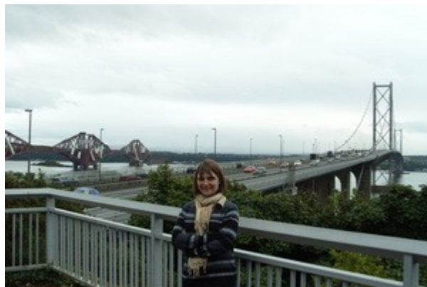
I due ponti tra Edimburgo e Queensferry visti dal giardino dell'hotel.

L'Hotel e' semplicemente perfetto. Posto subito fuori Edimburgo, in un sobborgo chiamato Queensferry, e' un hotel di lusso che siamo fortunatamente riusciti a trovare in "last minute" a quasi un terzo del prezzo di listino. Le camere sono grandi ed accoglienti, il servizio perfetto e la vista spazia dalla baia sottostante ai due ponti che collegano questa zona alla capitale e noti per essere stati inseriti su molti libri di architettura.