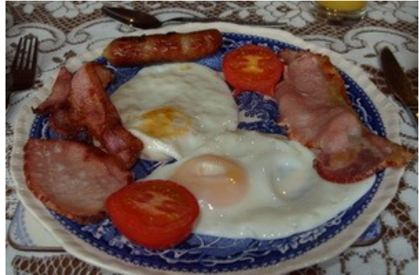
La tipica "English Full Breakfast".

ci fermiamo praticamente ad ogni piazzola a fare foto, tanto sono belli, e rilassanti, i luoghi; intorno a noi pochissima gente e il solo suono della natura. Il tempo, come in Irlanda, e' molto variabile, si passa dalla pioggerellina al sole in meno di un minuto. Il vento dell'oceano spinge le nuvole sempre molto velocemente. Sul lago ho fatto una foto panoramica in 5 scatti (30 secondo al massimo in tutto), nella prima pioveggina, in quella di mezzo no, nell'ultima c'era il sole!!