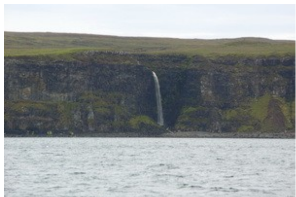
Dalla barca possiamo rivedere le stupende scogliere viste ieri da terra.

Alle 10 in punto, siamo 6 persone in tutto, si parte ! Sta' anche uscendo il sole, che non vedevamo da 2 giorni e non c'e' vento, non potevamo chiedere di meglio. Dopo meno di venti minuti ecco che sugli scogli vediamo gia' una colonia di foche, perfettamente mimetizzate con i colori della natura. Le avevamo gia' viste in liberta' in California, ma erano sul molo a sperare che i turisti gli dessero da mangiare, vederle cosi' in mare invece mi sembra piu' suggestivo e "naturale". Allontanandoci dalla baia entriamo nella parte