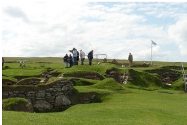
Il sito neolitico di Skara Brae

Prima tappa di oggi, e motivo principale della nostra visita, e' l'insediamento neolitico di Skara Brae che si e' guadagnato il titolo di patrimonio dell'umanita' da parte dell'Unesco. Senza voler annoiare nessuno dico solo che e' un villaggio che e' stato abitato dal 3.100 al 2.500 Avanti Cristo e con un grado di conservazione eccezionale poiche' e' rimasto sotto la sabbia per millenni e solo