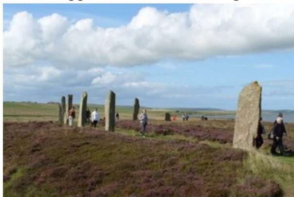
Il "Circle of Brodgar", ennesima testimonianza dell'importanza dell'isola in eta' preistorica.

Oltretutto questo sito archeologico oltre che ad essere il meglio conservato del mondo e' anche il secondo piu' antico d'Europa. Torniamo in pullman e ci dirigiamo verso la seconda tappa, il "Circle of Brodgar" o Cerchio di Brodgar.