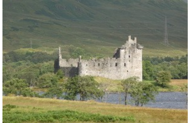
Il Kilchurn Castle, a Loch Awe.

Puntiamo verso Oban e per strada facciamo tappa sul Loch Awe sede del diroccato, ma suggestivo, Kilchurn Castle che e' raggiungibile tramite un sottile lembo di terra che si estende per oltre 1 km all'interno del lago. A proposito, qui tutti vengono chiamati Loch ma a volte sono laghi d'acqua dolce, a volte sono laghi d'acqua salata che si formano con le maree e a volte sono insenature del mare.