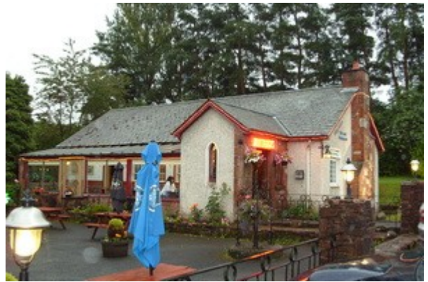
Il ristorante/pub di Croftamie, Drymen; la nostra prima cena in Scozia.

Dopo circa 1 ora di viaggio arriviamo a Drymen (in realta' e' una frazione vicina chiamata Croftamie), il b&b e' proprio bello e il proprietario e' simpatico e gentile. Qui vediamo per la prima volta gli orari. Uffici e negozi hanno un solo orario, unico, dalle 9 alle 17 di solito, la cena e' alle 18 e viene servita, fin che ce n'e' o fino alle 20 circa.