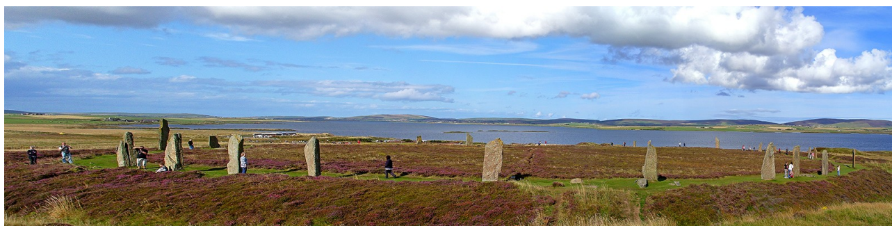
Il Ring of Brodgar, isole Orcadi.

Arriva il Giovedi della partenza e partiamo nel tardo pomeriggio all'uscita dal lavoro. L'arrivo in hotel ci lascia spiazzati, e' un 4 stelle di lusso e mi viene quasi paura che i 60 euro siano a testa, ad ogni modo vada come vada, abbiamo solo voglia di rilassarci e goderci l'imminente vacanza.